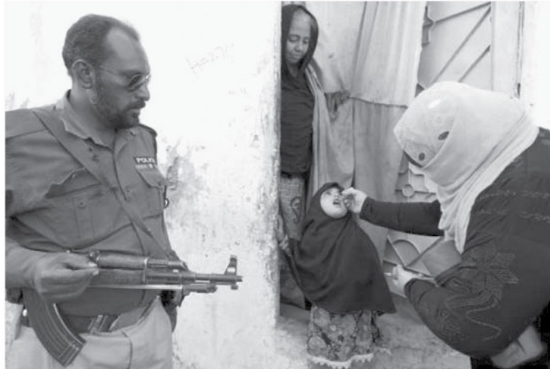
Una trabajadora sanitaria administra la vacuna contra la polio a una niña, el 15 de febrero en Karachi, Pakistán.

Rotary desde su inicio consideró estas necesidades, tal es así que en 1932 incorporó como Regla de Conducta de los Rotarios la denominada "Prueba Cuádruple" creada por el